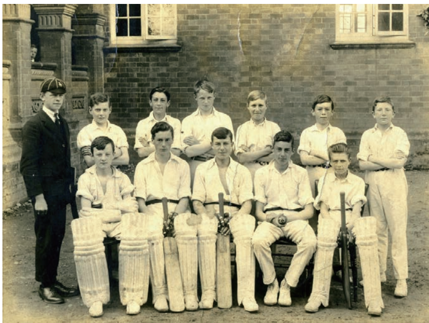
20世纪中期莱克顿学校的板球校队

几百年来，莱克顿学校和莱克顿县的居民都一直保持着和睦、友善的关系。在寒冷的冬季，学生帮助因为大雪丢失牲畜的居民寻找牲畜，为老人家们送去热餐热饮。学校的社区公益服务一直都是学校的优良传统，学校和当地的融洽关系也是学校发展生生不息的坚强后盾。