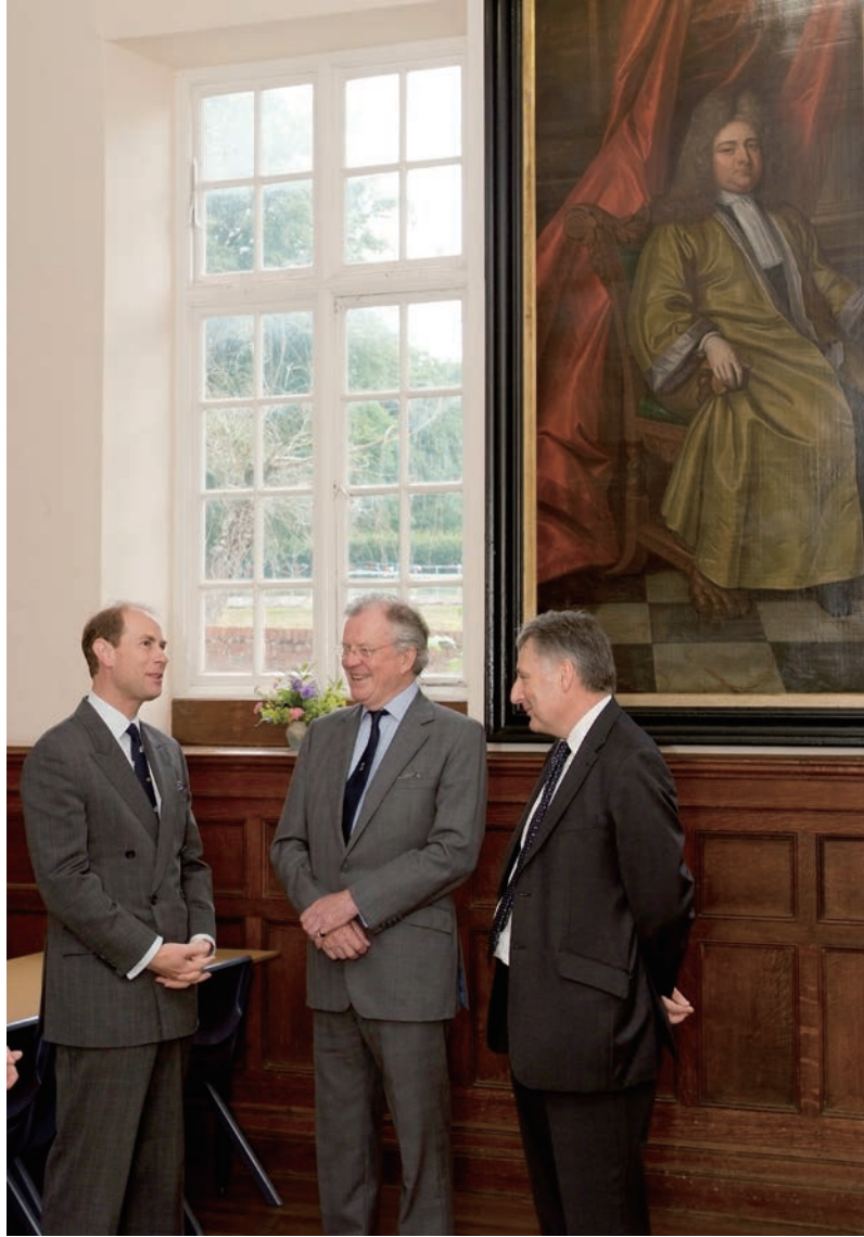
爱德华王子 (Prince Edward) 在创始人约翰的画像下追溯莱克顿学校的办学历史