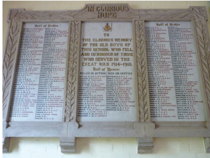
一战期间，上百名莱克顿毕业的学生参加了这场当时人类历史上最大规模的战争

1902年，教育委员会（Board of Education）替代 S.P.C.K. 对莱克顿学校进行监管。于此同时，赫里福德郡的议会也加强了对莱克顿的审查。校董们兢兢业业，认真勤奋地工作着。学校迎来了来自英格兰不同地区以及威尔士的学生，还有个别来自印度和俄国的学生。教育委员会定期出审查报告，因为财政和生源不稳定的因素，莱克顿学校最初的审查报告不尽如人意。但是接到审查结果报告的校董们立刻和校长一起进行整改，对学生日常的行为进行更好地规范。因此，每六年的审查结果都有提高，莱克顿学校不断被认可。其实，在此过程中，学校也经历了一些波折。为了得到政府对于学校的补助金，校董们向教育委员会申请成为正式的中学（Secondary School），但是教育委员会提出附带条件，例如，让莱克顿学校淡化英国国教元素，变身一所非宗教派别的学校。莱克顿县的校董们觉得这并不是约翰本人想要的，这也不会是伦敦的校董会乐意见到的。所以就撤回了申请。莱克顿学校在 1908 举行了建校 200 周年庆。此次校庆受到了政府的大力表彰并举办了