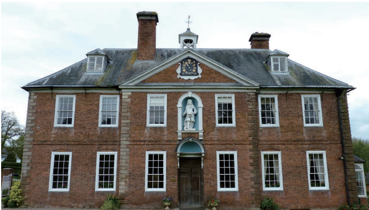
为纪念时任英国女王的安妮女王 (Queen Anne) 对莱克顿办学的支持, 学校具有 300 年历史的主楼被命名为安妮女王楼 (Queen Anne Building)