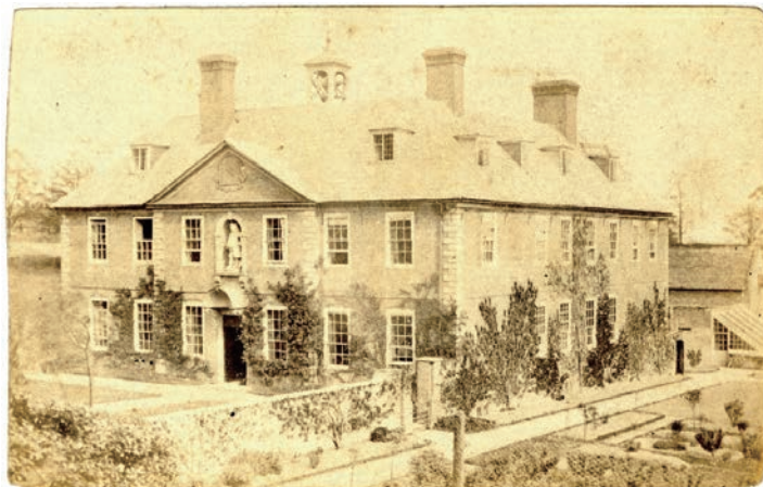
学校主楼早期的照片

伦敦校董会在 1712 年的 4 月 10 日举行了第一次会议。随后，他们定期举行会议，商议学校规章、教学内容、教员工资及学校运营等事宜。可惜的是，伦敦的校董会由于当时交通不便，从没有来过莱克顿县。倒是在北赫里福德郡的第二套校董班子会定期在学校举行会议。他们会根据学校实时的情况提出反馈建议，然后这些反馈建议和会议总结会送到伦敦的校董会，听取他们的意见，最终制定实行方案。