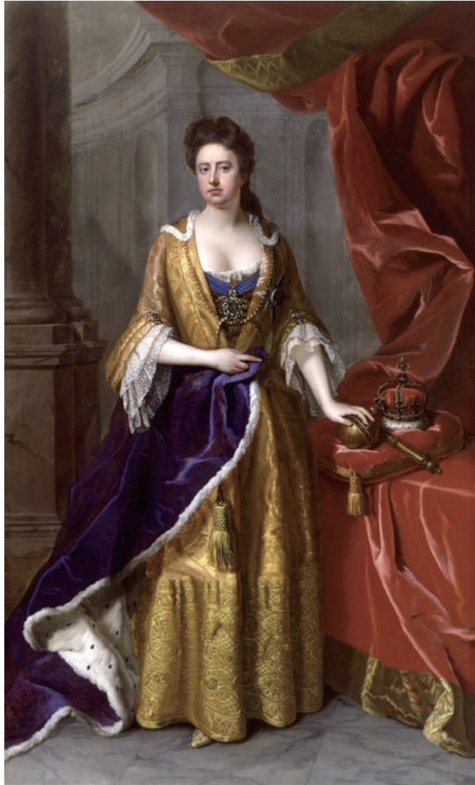
安妮女王 (Queen Anne) 画像