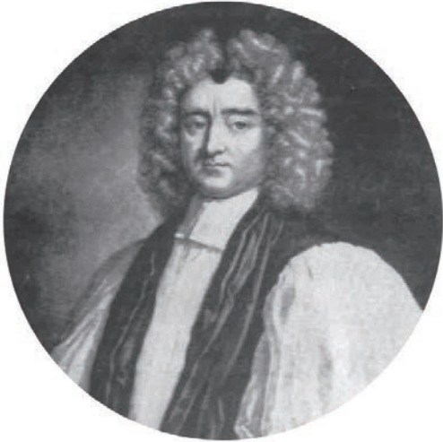
怀特牧师 (Dr White Kennett) 像