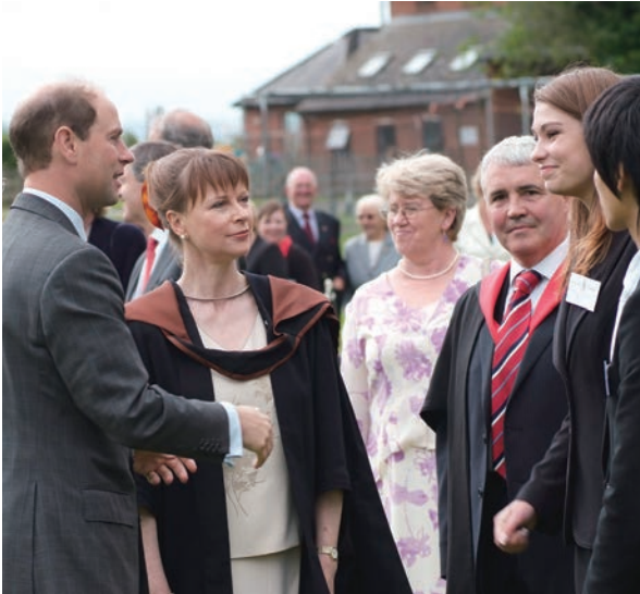
2008年，爱德华王子 (Prince Edward) 代表皇室参加莱克顿学校300年校庆